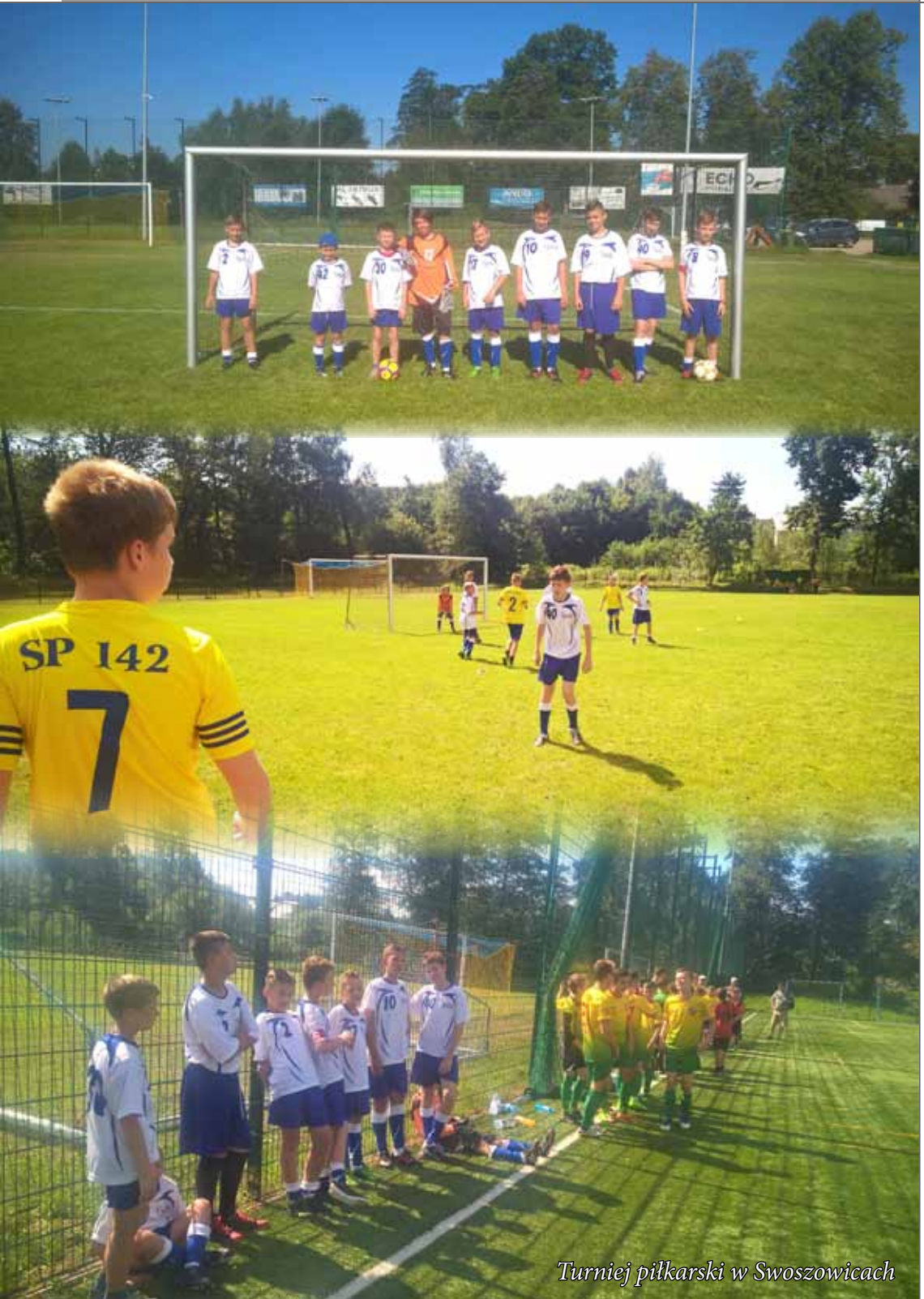
Turniej piłkarski w Swoszowicach